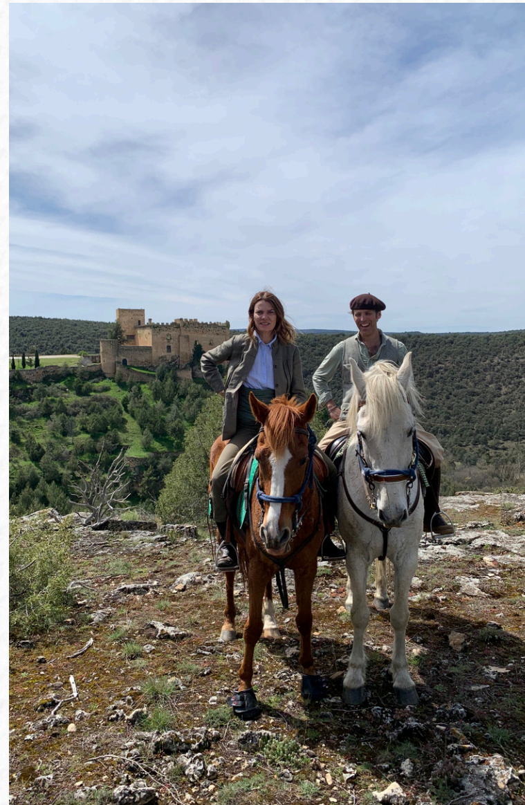
Castillo de Pedraza